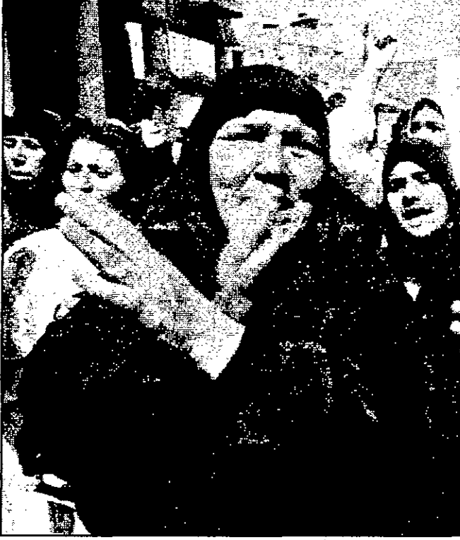
عراقيات يعفن ضد الولايات المتحدة أثناء تشييع الماعل من ضحايا الحظر في بغداد